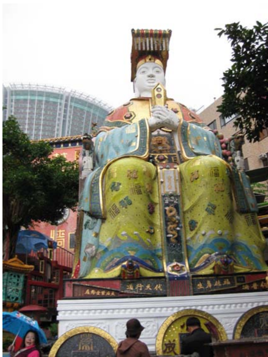
เจ้าแม่ทับทิม