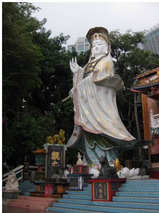
เจ้าแม่กวนอิม