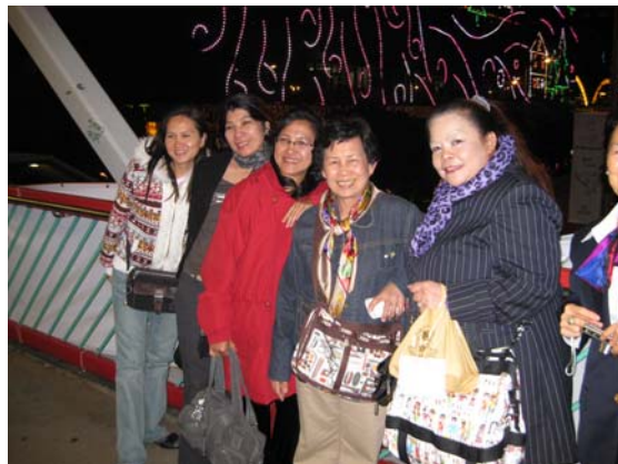
คืนแรกในฮ่องกง