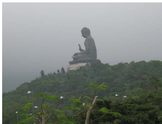
พระใหญ่วัดโป้หลิน