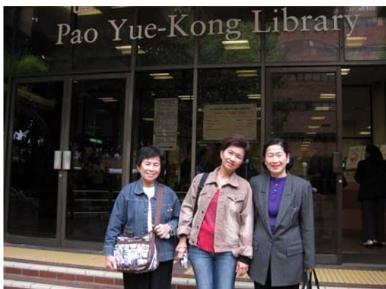
หน้าห้องสมุด Pao Yue – Kong Library (The Hong Kong Polytechnic University Library)