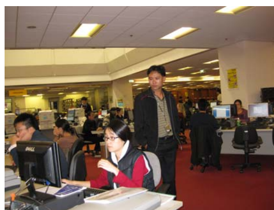
ค้นข้อมูล