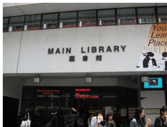
Main Library (University of Hong Kong Library)