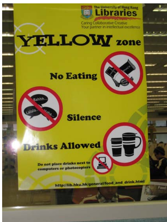
ป้าย Yellow Zone