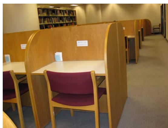
โต๊ะเดี่ยวอ่านหนังสือ