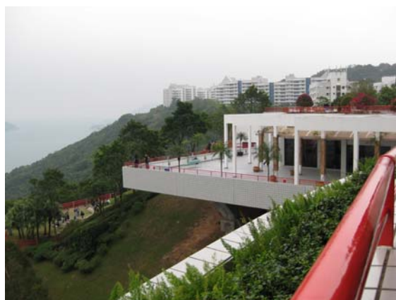
ภาพวิวของมหาวิทยาลัย