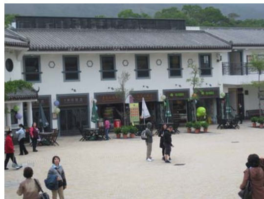
ภายในบริเวณหมู่บ้านวัฒนธรรมนองปิง