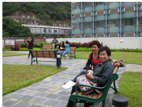
บริเวณลานพักผ่อนบนตึกห้องสมุด