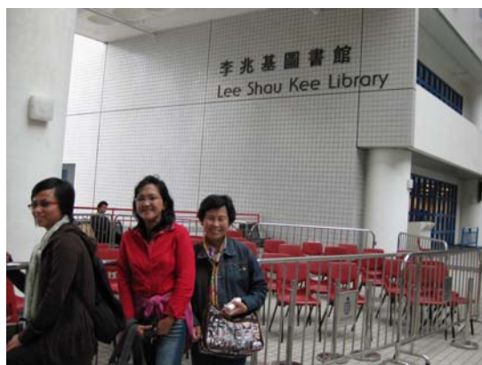
Lee Shau Kee Library (Hong Kong University of Science and Technology Library)