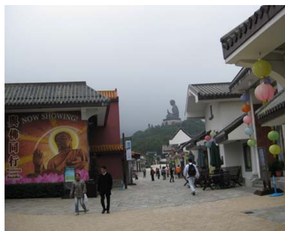
ภายในบริเวณหมู่บ้านวัฒนธรรมนองปิง