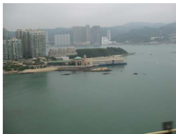
ส่องกงเต็มไปด้วยตึกสูงๆ