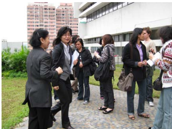
บริเวณลานพักผ่อนบนตึกห้องสมุด