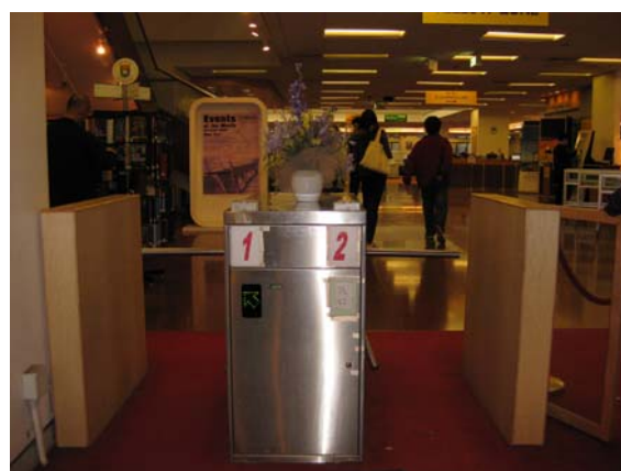
ทางเข้าห้องสมุด