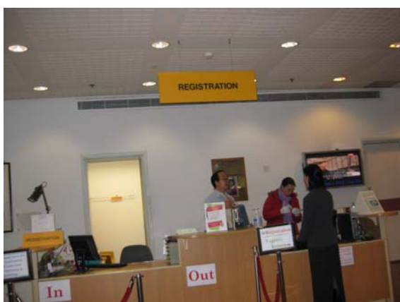
ลงทะเบียนทำบัตรสมาชิก