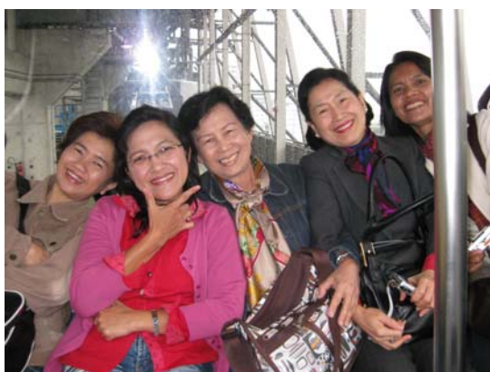
เดินทางโดยเคเบิลคาร์ไปหมู่บ้านวัฒนธรรม นองปิง