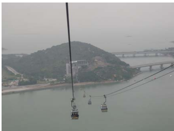
เคเบิลคาร์