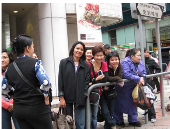
ยื่นรอรบัส