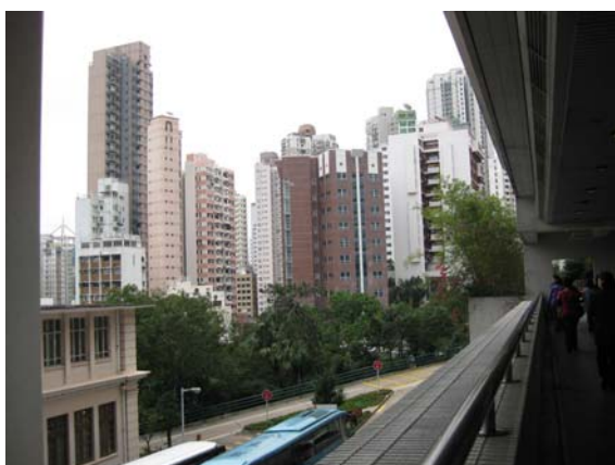
ส่องกงเต็มไปด้วยตึกสูงๆ