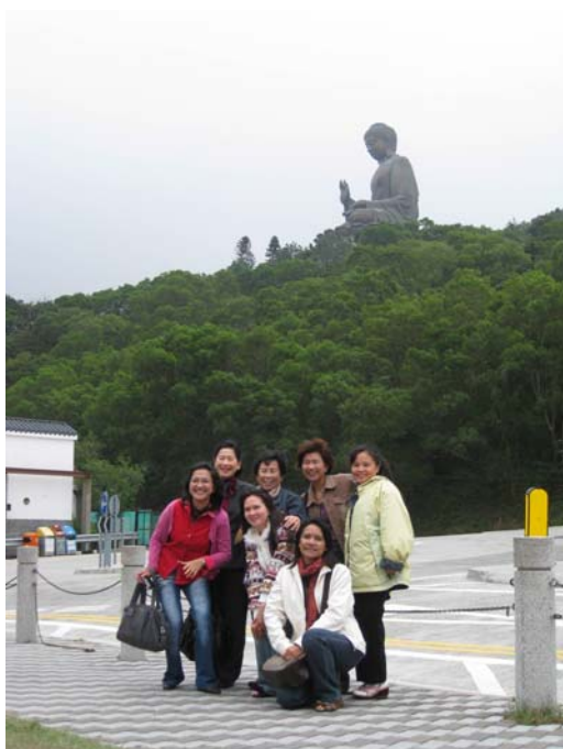
ด้านหลังบนยอดเขา คือ พระใหญ่วัดโปหลิน