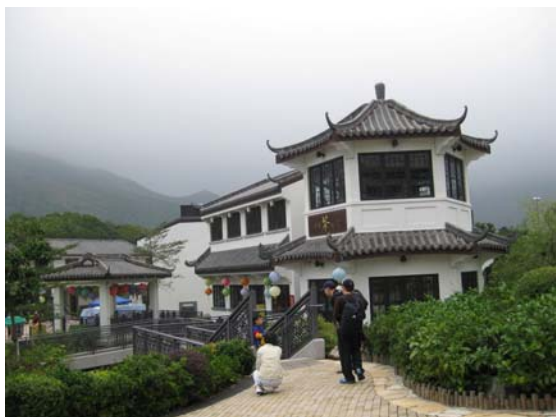
หมู่บ้านวัฒนธรรมนองปิง