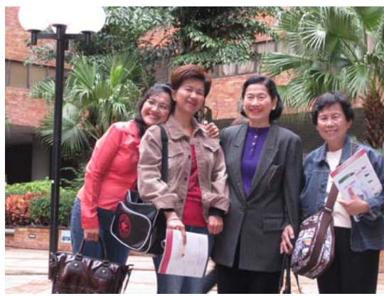
บริเวณภายในมหาวิทยาลัย