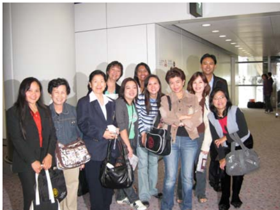
ท่าอากาศยานนานาชาติสุวรรณภูมิ