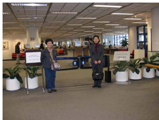
ทางเข้าห้องสมุด