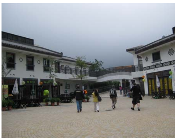
ภายในบริเวณหมู่บ้านวัฒนธรรมนองปิง