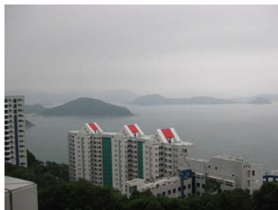
ภาพวิวของมหาวิทยาลัย