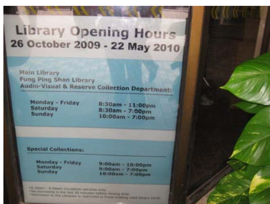
เวลาเปิดปิดห้องสมุด