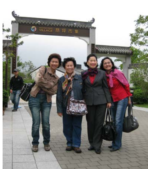
หน้าประตูทางเข้า / ออกบริเวณวัดโปหลิน